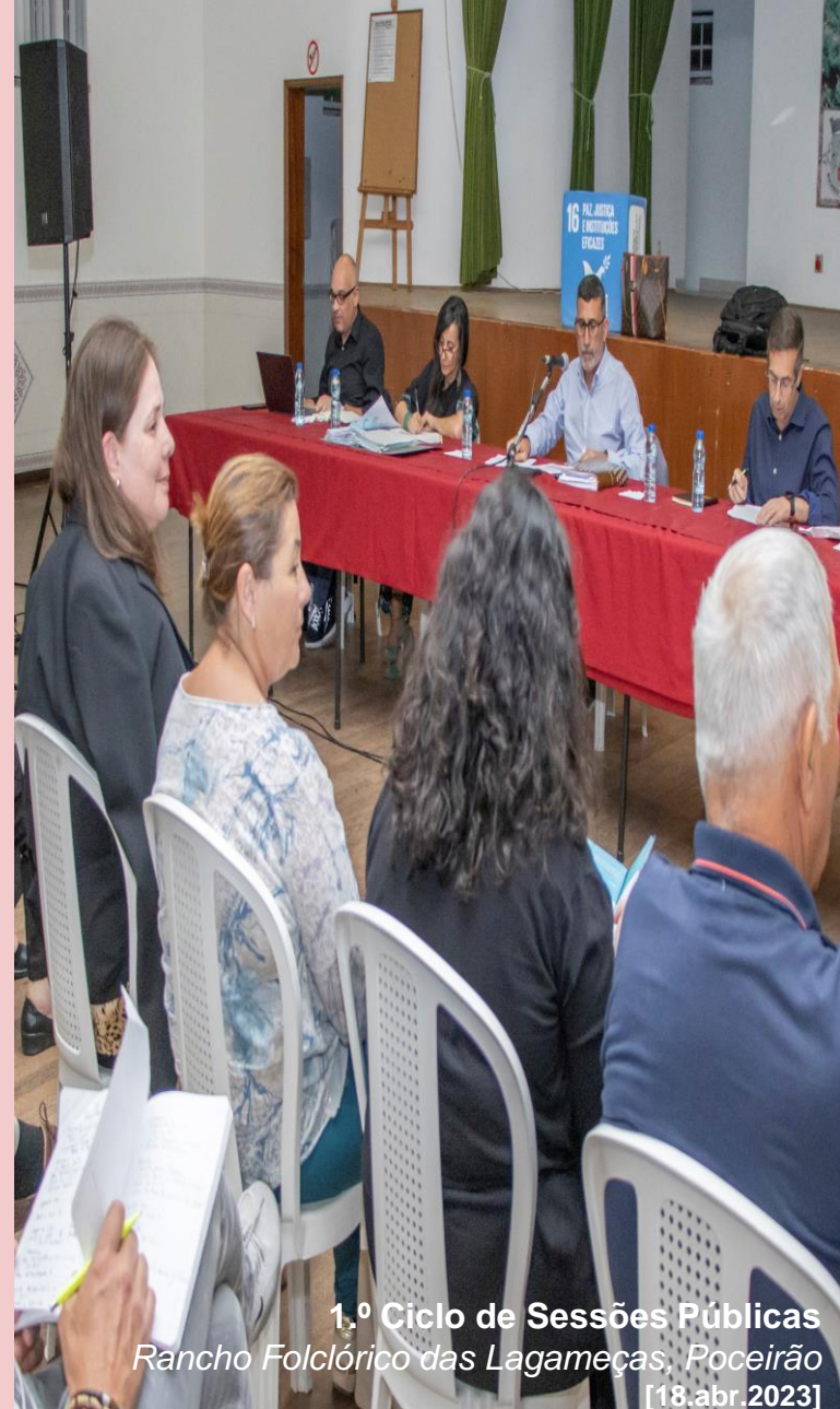
1.º Ciclo de Sessões Públicas Rancho Folclórico das Lagameças, Poceirão [18.abr.2023]

Preenchimento dos questionários disponíveis nas Juntas de Freguesia e nos edifícios municipais, mantendo o mesmo princípio do preenchimento dos dados de identificação.