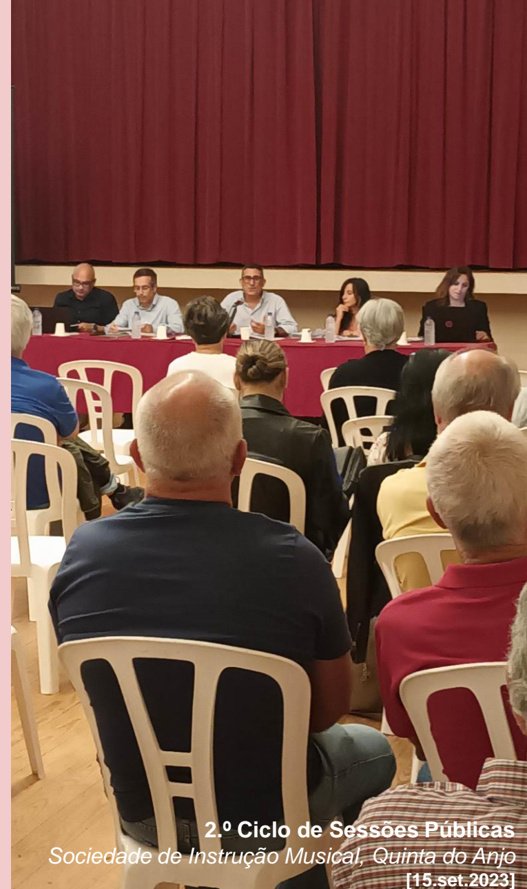
2.º Ciclo de Sessões Públicas Sociedade de Instrução Musical, Quinta do Anjo [15.set.2023]