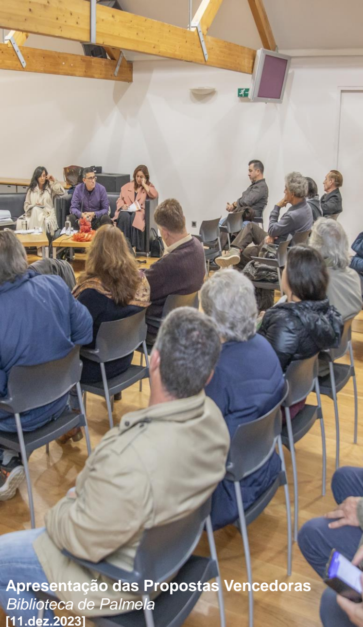
Apresentação das Propostas Vencedoras Biblioteca de Palmela [11.dez.2023]