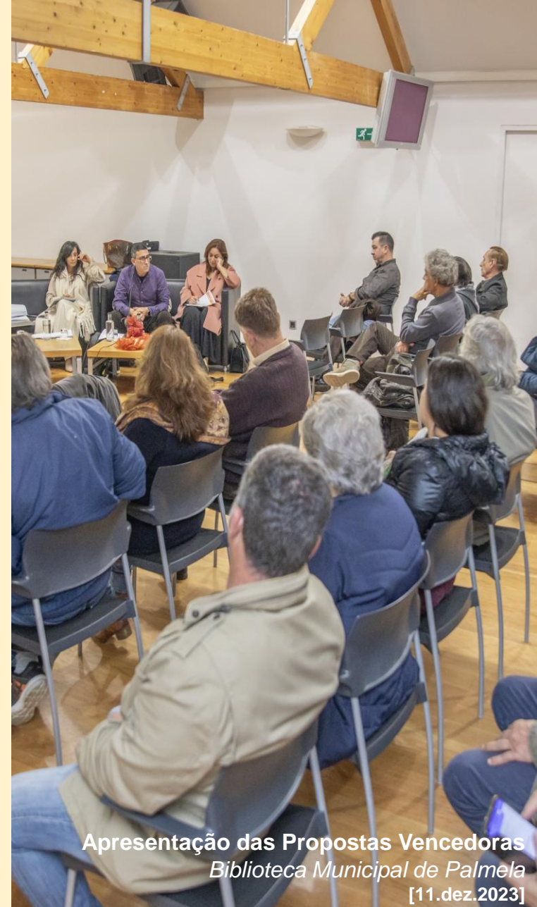
Apresentação das Propostas Vencedoras Biblioteca Municipal de Palmela [11.dez.2023]