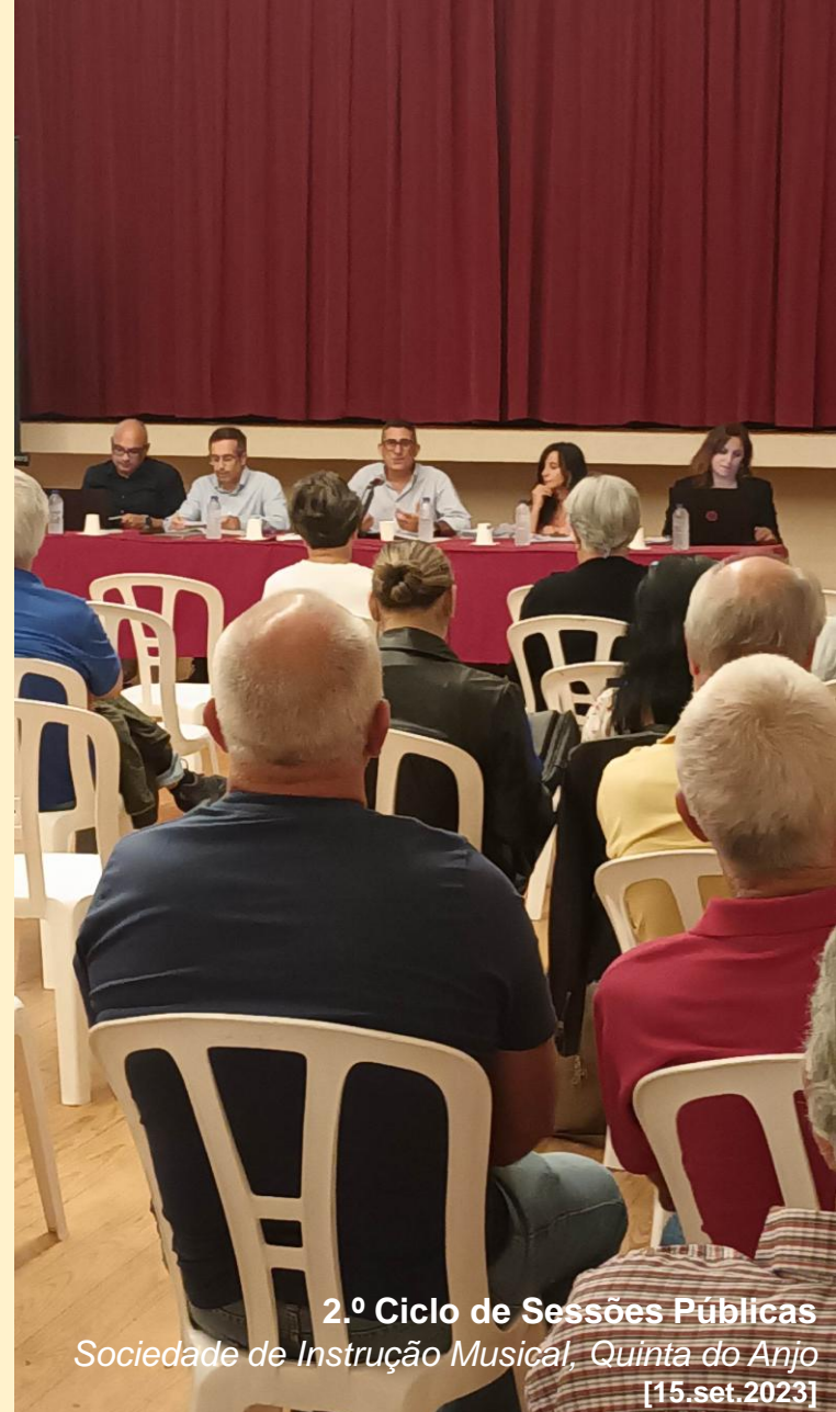
2.º Ciclo de Sessões Públicas Sociedade de Instrução Musical, Quinta do Anjo [15.set.2023]

O período de apresentação das propostas decorre de 7 de abril a 31 de maio.