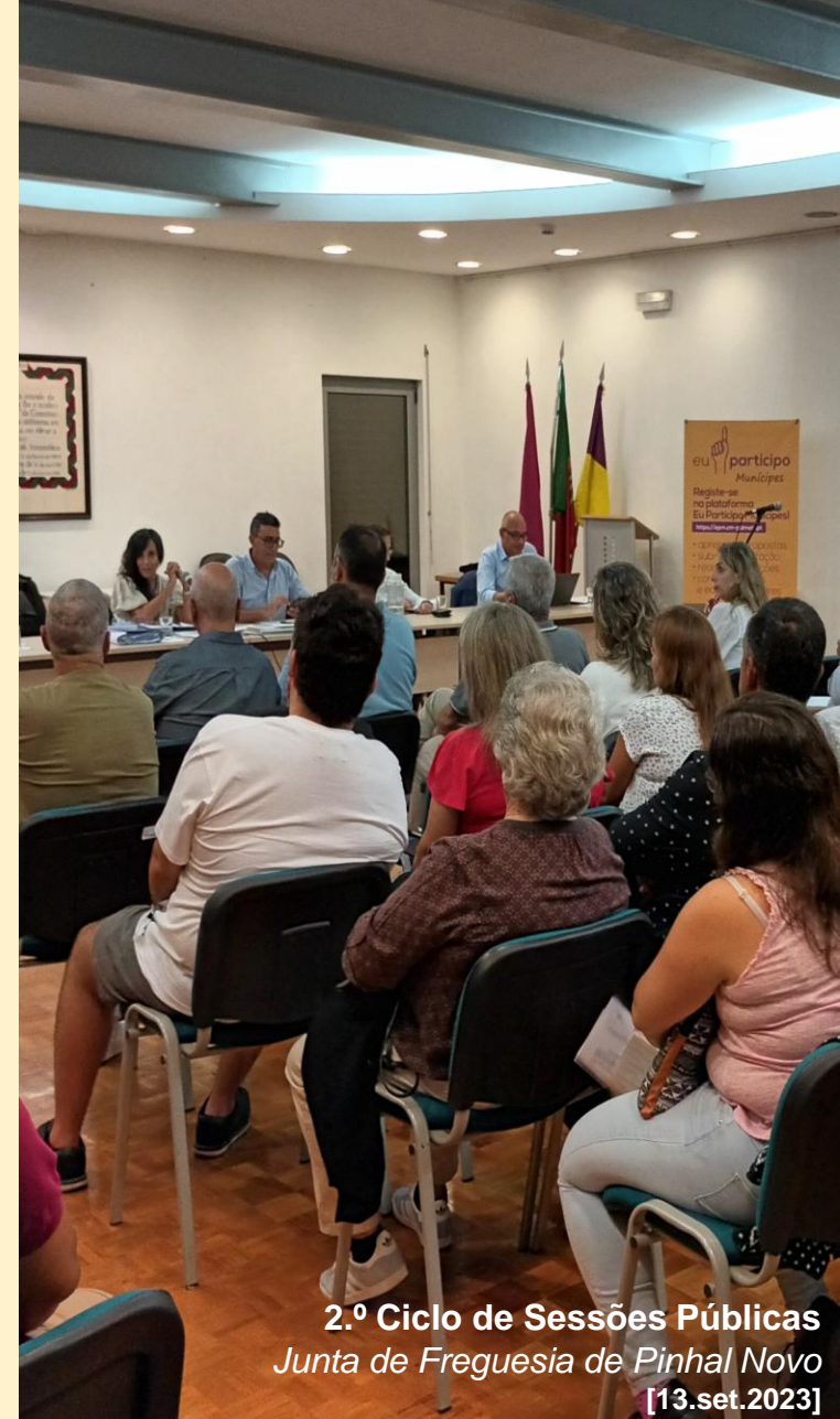
2.º Ciclo de Sessões Públicas Junta de Freguesia de Pinhal Novo [13.set.2023]